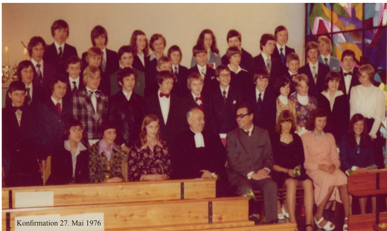
Konfirmation 27. Mai 1976